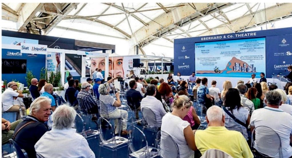
Particolarmente ricco il programma dei forum di questa edizione del Salone Nautico

Il palinsesto dei forum del 64° Salone Nautico Internazionale di Genova, anche per questa edizione, offre una varia gamma di convegni istituzionali e workshop, realizzati in collaborazione con Confindustria Nautica.