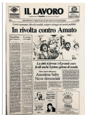
La prima In alto, ecco la prima pagina del Lavoro che il 22 settembre '92 esce in abbinamento con Repubblica