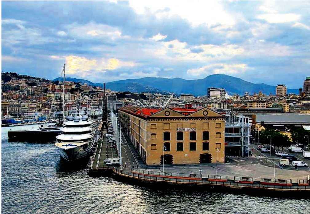
▲ Porto Antico Inaugurato nel 1992, anno in cui Repubblica ha aperto la redazione