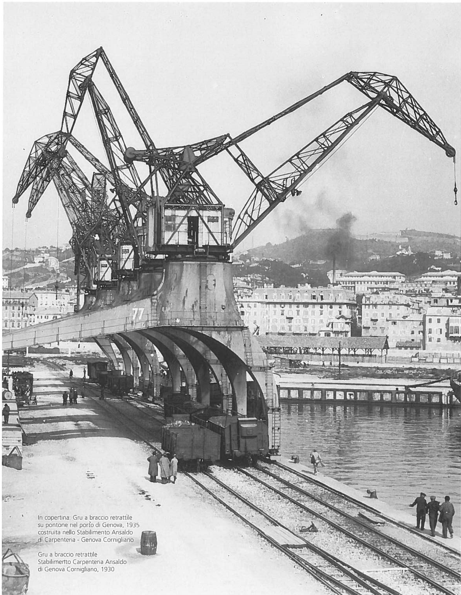
In copertina: Gru a braccio retrattile su pontone nel porto di Genova, 1935 costruita nello Stabilimento Ansaldo di Carpenteria - Genova Cornigliano