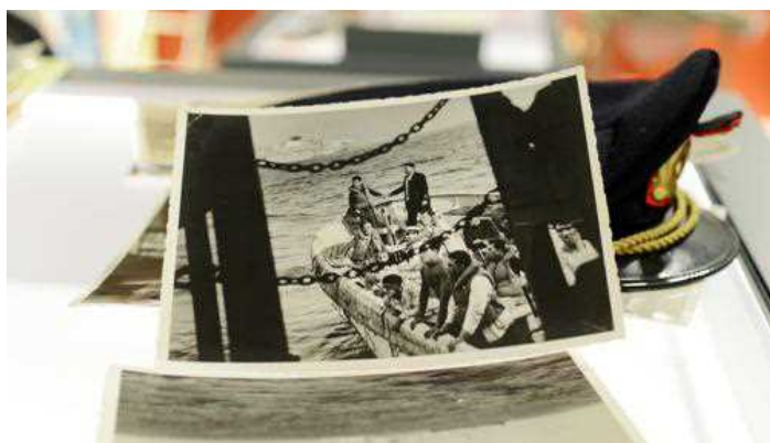
La mostra al Galata Museo del Mare