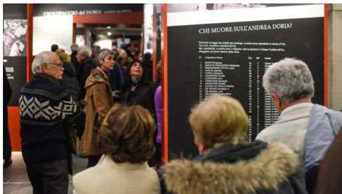
"Andrea Doria, La nave piu' bella del mondo" la sezione dedicata alle vittime