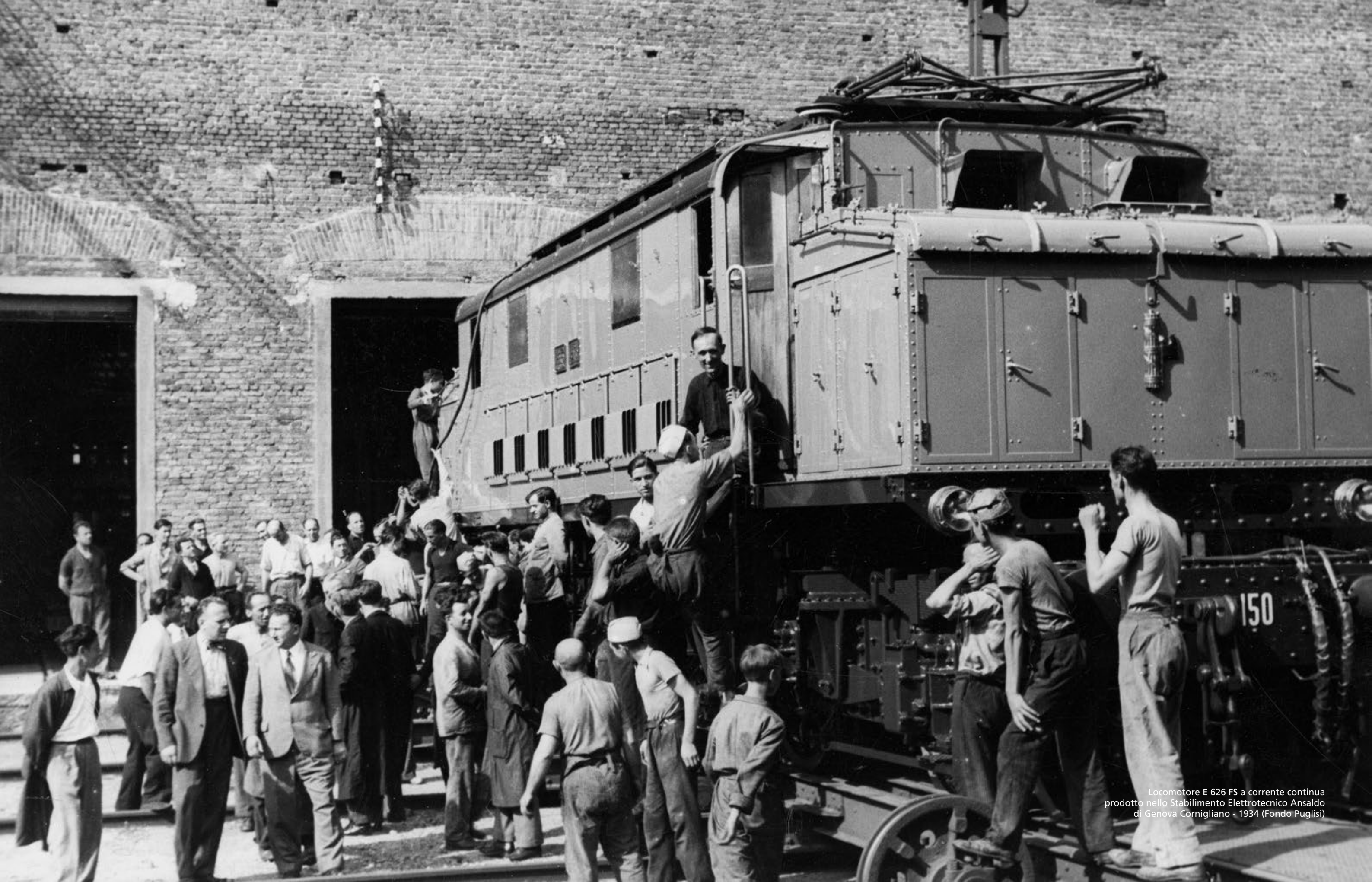
Locomotore E 626 FS a corrente continua prodotto nello Stabilimento Elettrotecnico Ansaldo di Genova Cornigliano - 1934