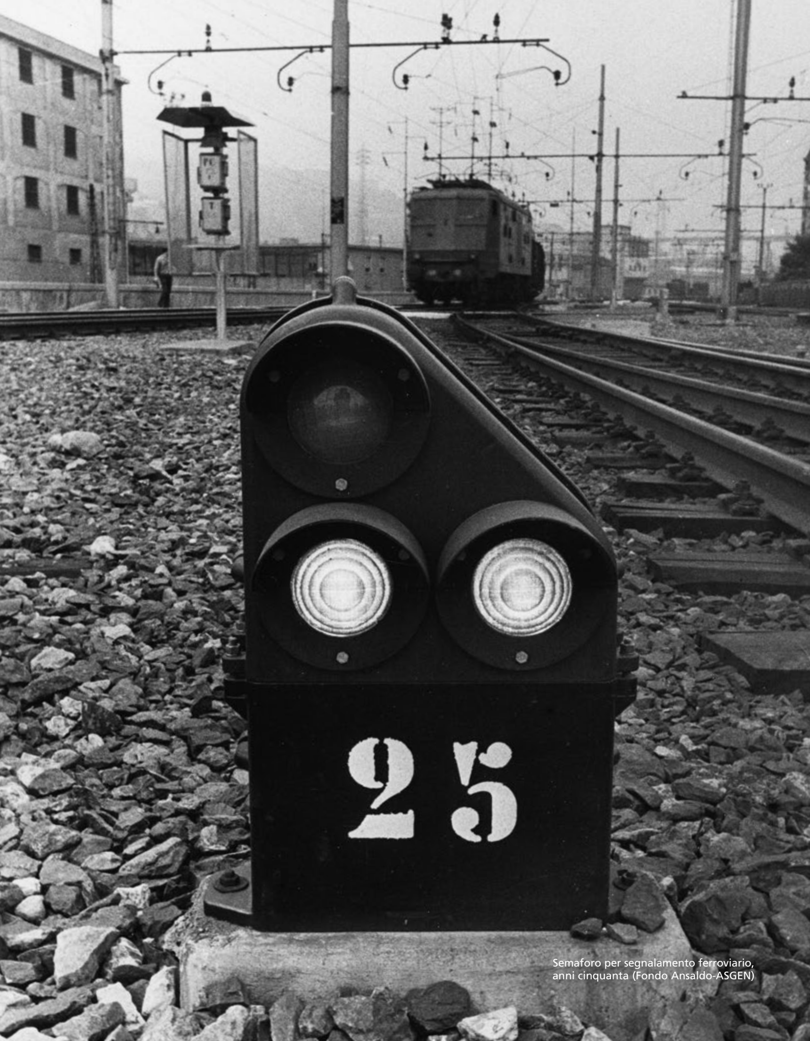
Semaforo per segnalamento ferroviario, anni cinquanta (Fondo Ansaldo-ASGEN)